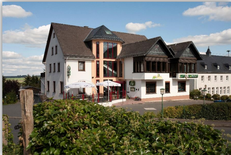
Außenansicht Haus Hubertus